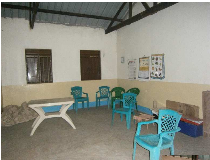
...e l'ufficio così!