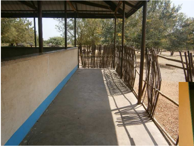
La veranda adesso è così...